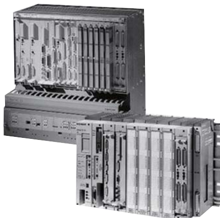
1969年米国で販売された世界最初の PLC Modicon 084

続いての特長は容易な拡張性が挙げられます。大規模な制御をする場合は PLC 同士をネットワークでつなぐ事ができ、I/O を拡張する場合には、パソコンのようにドライバをインストールする必要は無く、玩具ブロックのような