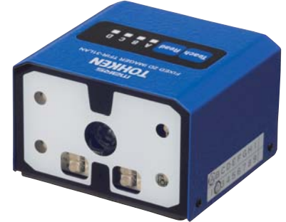
PLC 直接接続の固定式 小型高性能 2次元コードスキャナ TFIR-31LAN for PLC

先月号は、製造/物流現場の自動制御では欠かせない装置であるPLC(プログラマブルロジックコントローラ)の誕生の必要性和現場からの新たな要望をお知らせいたしました。今月号は、当社が発売した通信プログラム不要の簡単!PLCリンク機能を搭載したバーコードスキャナのご案内を中心にPLCをさらに掘り下げてご紹介いたします。