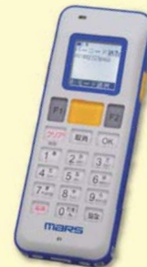
インテリジェントデータコレクタ MID-100

「自動認識総合展 大阪」は、関西で唯一の自動認識機器、ソリューションの専門展示会です。新製品のインテリジェントデータコレクタをメインに出展いたします。その他、各種スキャナ等を展示して、ご来場をお待ちしています。