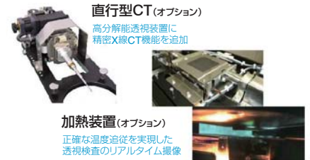
直行型CT (オプション)

微細な電子部品から実装基板まであらゆる場面で活用できるX線検査装置。 簡単に着脱可能なユニット方式のオプションで検査の領域が広がります。