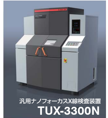
汎用ナノフォーカスX線検査装置 TUX-3300N

明けましておめでとうございます。本年もどうぞよろしくお願いいたします。 今号では、世界に誇る品質、安心・安全の「Made in Japan」の技術力を支える展示会「エレクトロテストジャパン」のご紹介です。日本最大級!エレクトロニクス検査・試験・測定・分析技術展として、1月13日から3日間の予定で、東京ビックサイトにて開催されます。 当社からは、昨年10月に合併して新たな事業の柱となったX線検査事業部の非破壊検査 X線顕微装置などを出展いたします。